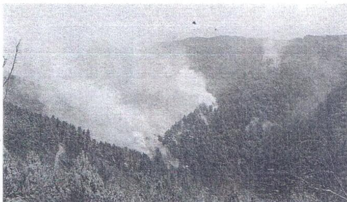
In una foto d'archivio uno dei tanti incendi nella Riserva